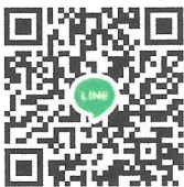
QR CODE กลุ่มอบรมฯ

ผู้อำนวยการสถาบันพัฒนาบุคลากรท้องถิ่น ปฏิบัติราชการแทน อธิบดีกรมส่งเสริมการปกครองท้องถิ่น